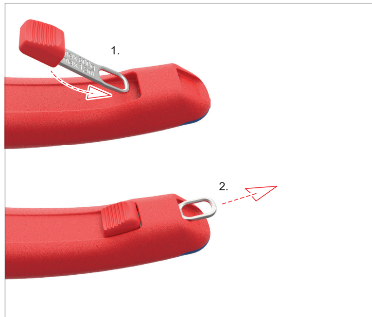
Putoamissuojauksen kiinnityslenkin kiinnittäminen