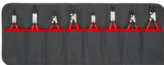
00 19 58 V01