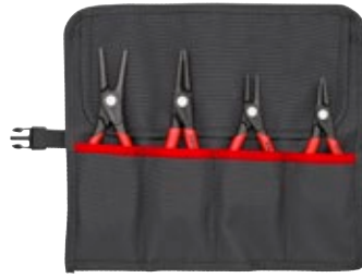
00 19 57