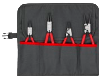
00 19 56 V01