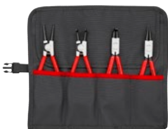
00 19 56