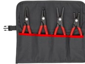
00 19 57 V01