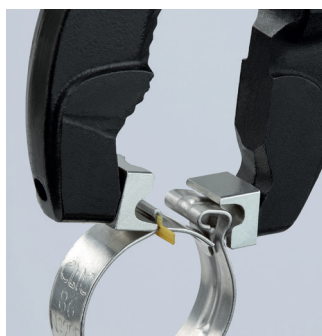
Schließen einer Schlauchschelle ohne Anschlag