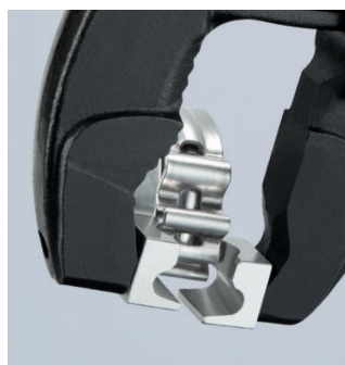
Öffnen einer Schlauchschelle mit Anschlag