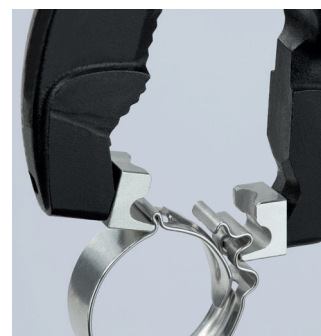
Schließen einer Schlauchschelle mit Anschlag