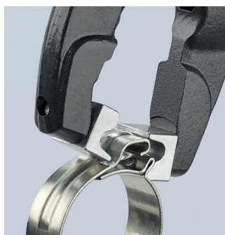
Öffnen einer Schlauchschelle ohne Anschlag