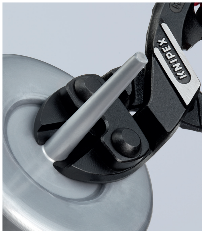
Ideal zum bündigen Schneiden von Angüssen aus Kunststoff mit größeren Durchmessern