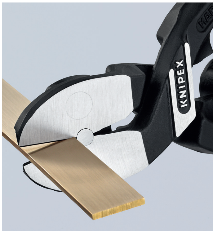
Stromschielen aus Kupfer werden sauber und flächenbündig abgeschnitten

Durch die nahezu facettenfreie Präzisionsschneide werden Werkstoffe bündig abgetrennt