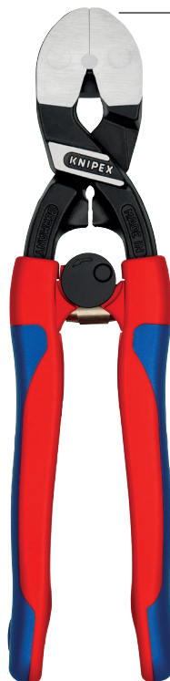
Ansicht der Zangen-Rückseite