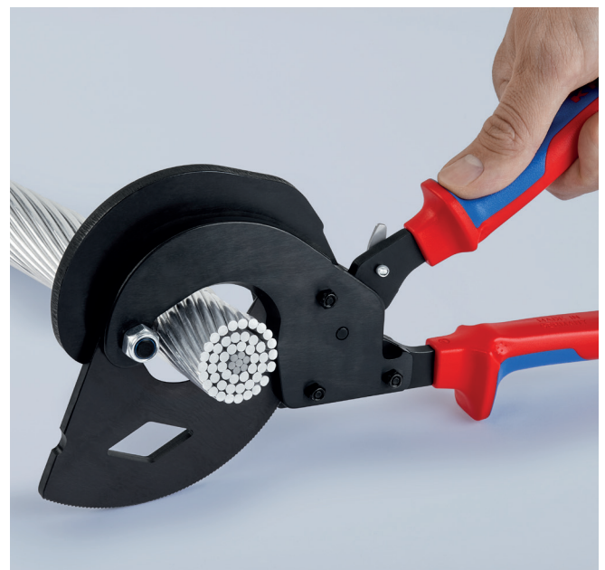
Der robuste „Kragen“ der Griffhülle dient als praktische Standfläche zum Aufsetzen beim Schneiden größerer Durchmesser