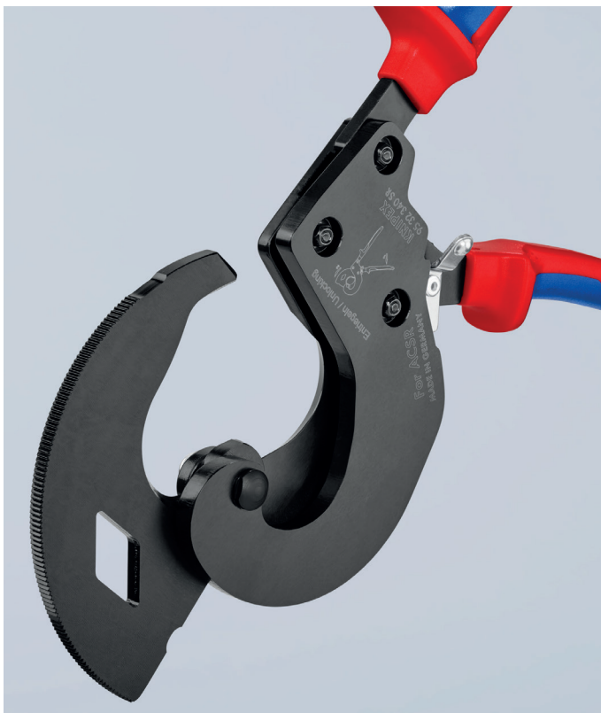
Enorme Kraft bei nur 1.300 g Gewicht

Der äußere Bereich dieser Freileitungssseile besteht aus leichten, hochleitfähigen Aluminiumdrähten, der Kern aus besonders dehnungsfesten verzinkten Stahldrähten