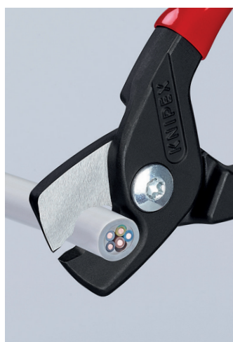
Bolteledd: presis, uanstrengt, robust; klemvern gir beskyttelse og sikkert arbeid