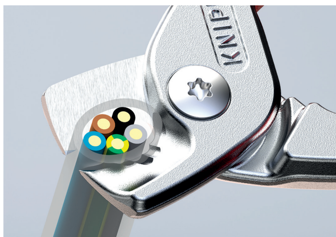
Kutter massive kobber- og aluminiumskabler på opptil 5 x 4 mm 2

Graderingene kutter lederne én etter én, uten deformering