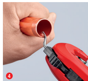
4 et voilà ! Au besoin, lissez l'arête de coupe avec l'outil d'ébavurage escamotable, avec étonnamment peu d'effort