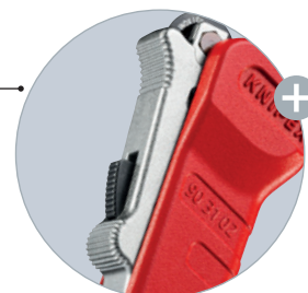
La molette de coupe renforcée peut être poussée et fixée sur le diamètre du tube avec le verrouillage en butée rapide à une main