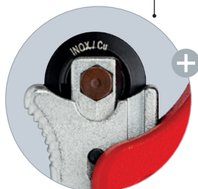
La molette de coupe renforcée à roulement à aiguilles en acier spécial est facilement interchangeable