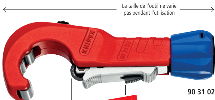
La taille de l'outil ne varie pas pendant l'utilisation