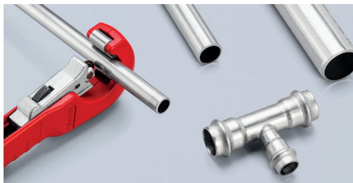
Rapidité au quotidien : le verrouillage en butée rapide d'une seule main QuickLock permet à la molette de coupe de coulisser sur n'importe quel diamètre de tube d'une simple pression du pouce