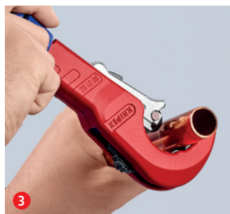
3 Coupez rapidement, puis réajustez à l'aide du pommeau ergonomique bleu ...