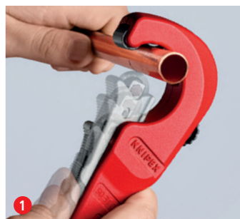
1 Couper simplement : placez le KNIPEX TubiX® ouvert ...