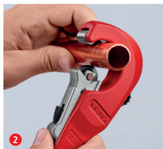
2 Poussez la molette de coupe contre le tube avec le système QuickLock à verrouillage en butée rapide d'une seule main : le réglage le plus rapide pour différents diamètres de tubes ...