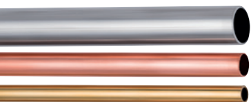
Pour couper tubes en cuivre, laiton et acier inoxydable d'une épaisseur de paroi jusqu'à 2 mm et d'un diamètre de 6-35 mm (1/4" - 1 3/8")